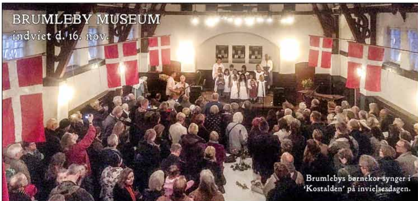
Brumlebys børnekor synger i 'Kostalden' på invokationsdagen.

Igen gennem flere år har beboerne i Brumleby på Østerbro, de tidligere Lægforeningens Boliger, kæmpet for at få etableret et museum for bydelens historie. Det åbnede så i denne uge, idet man havde fået restaureret den gamle Brugsforening, der startedes som den første i Danmark, i 1866.